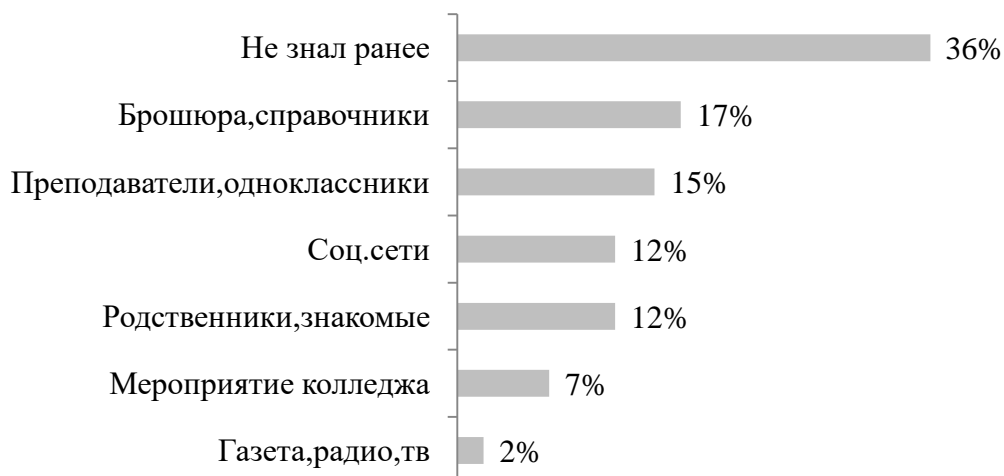
Рисунок 2. Рейтинг источников информированности респондентов по поводу колледжа (в%, от числа тех, кто знаком с колледжем)

При ответе на вопрос «Откуда Вы впервые узнали о колледже?» среди наиболее популярных источников оказались: брошюры и преподаватели. Однако большинство респондентов не знали ранее о колледже. Данные представлены на рисунке 2.