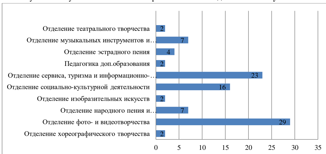
Рисунок 1. Результаты ответов на вопрос «На каком отделении Вы обучались?»

В целом можно отметить, что опрошенные выпускники удовлетворены обучением в колледже. На вопрос « Насколько Вы удовлетворены обучением в Губернаторском колледже? » ответы следующие: